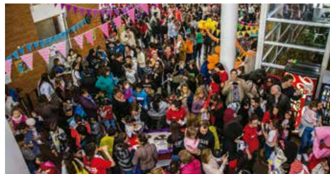
Día del Niño organizado por empresas integrantes de Unidos por Teletón

Se genera una simbiosis entre Teletón y la empresa. Mientras que el trabajo del voluntario corporativo potencia la gestión de la Fundación, el grupo y la empresa se benefician del valor que agrega el trabajar en conjunto por una causa.